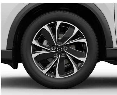
FELGI ALUMINIOWE (19) 225/55 W KOLORZE BLACK METALLIC