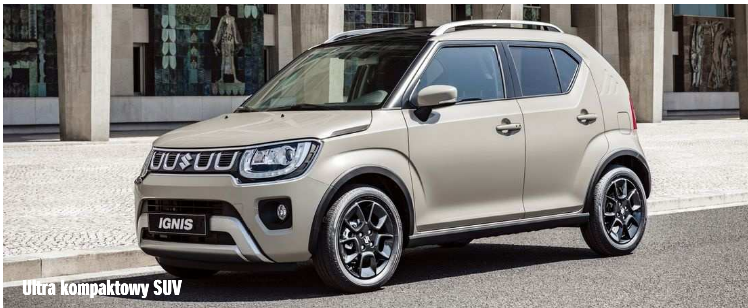
Ultra kompaktowy SUV

IGNIS HYBRID łączy wyjątkowe nadwozie z komfortowym i obszernym wnętrzem w stylu typowym dla Suzuki, prezentując całkowicie nowe wzornictwo i unikatowy charakter. W odświeżonej wersji IGNIS HYBRID otrzymał nową osłonę chłodnicy oraz przednie i tylne zderzaki. W ofercie pojawiły się nowe kolory nadwozia i akcenty kolorystyczne we wnętrzu. Ten ultra kompaktowy SUV oferuje doskonałe osiągi oraz znakomite wrażenia z jazdy w każdych warunkach drogowych. Innowacyjny silnik benzynowy 1.2 DUALJET wspomagany przez układ „mild hybrid” zapewnia wystarczającą moc, a do tego jest oszczędny i przyjazny środowisku. Futurystycznie zaprojektowana i przestronna kabina, duży bagażnik (aż do 267 litrów pojemności) oraz wysoka pozycja za kierownicą decydują o wszechstronności tego modelu. Możliwość wyboru napędu na 4 koła ALLGRIP AUTO podnosi użyteczność pojazdu przy eksploatacji na trudniejszych nawierzchniach.