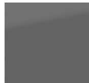
KOLOR LAKIERU: Titan Dark Gray Pearl (ZZZ)